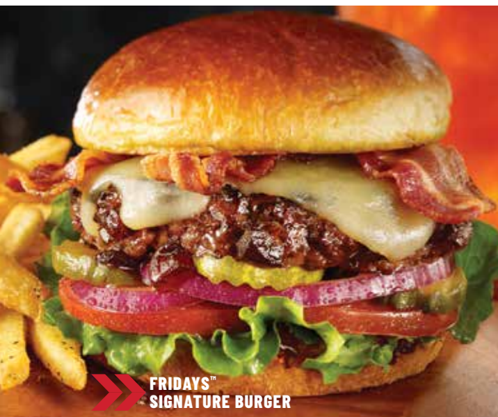
FRIDAYS ™ SIGNATURE BURGER