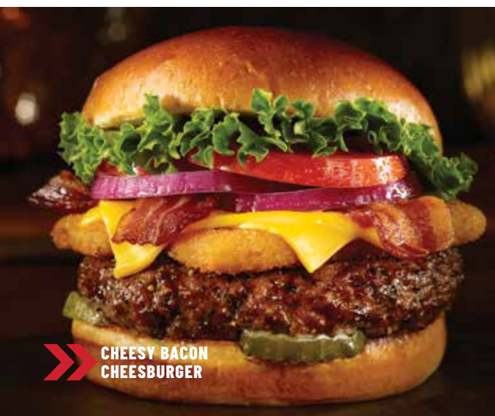
CHEESY BACON CHEESEBURGER