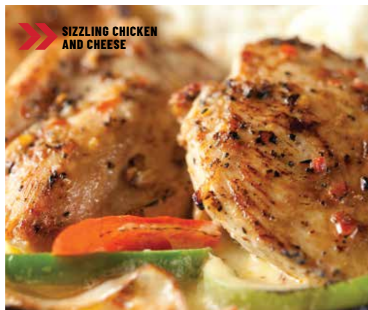
SIZZLING CHICKEN AND CHEESE