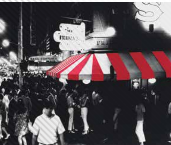
1965 New York - Az első TGI Fridays.