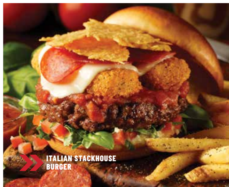
ITALIAN STACKHOUSE BURGER