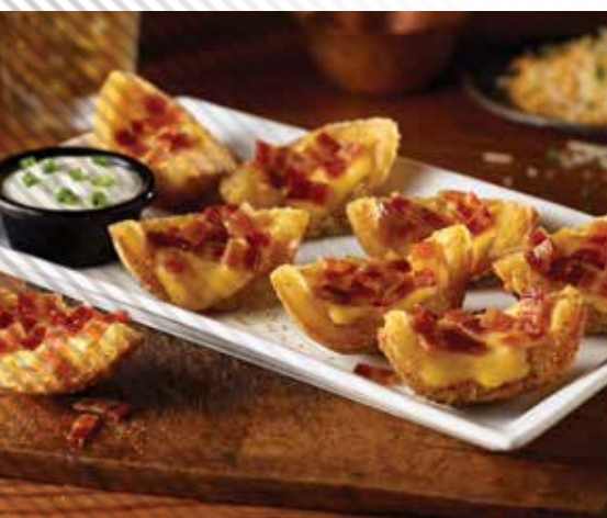
1974-ben megalkottuk a töltött burgonyacsónakokat - azóta is a kedvencünk!